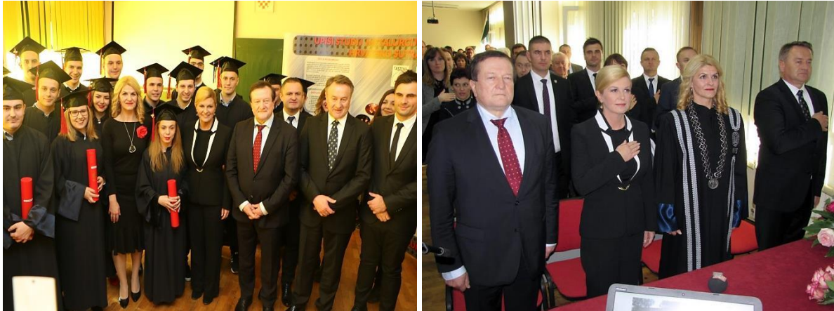
Slika 4. Predsjednica Republike Hrvatske Kolinda Grabar Kitarović na svečanoj sjednici Fakultetskog vijeća Metalurškog fakulteta, 5.12.2018.

uživa prepoznavanje i vrednovanje utjecajnih čimbenika poput Sveučilišta u Zagrebu te Sisačko-moslavačke županije kao predstavnika lokalne i javne politike. Ogleda se to u potpori i partnerstvu obje institucije nastojanjima Metalurškog fakulteta da ulaganjem u znanstvenoistraživačke kapacitete dosegne izvrsnost i slijedom navedenog inovira nastavne programe. Značaj Metalurškog fakulteta za Republiku Hrvatsku dodatno je naglašen posjetom predsjednice Republike Hrvatske Kolinde Grabar Kitarović povodom proslave 58. obljetnice Metalurškog fakulteta, 5. prosinca 2018. godine kako je prikazano slikom 4.