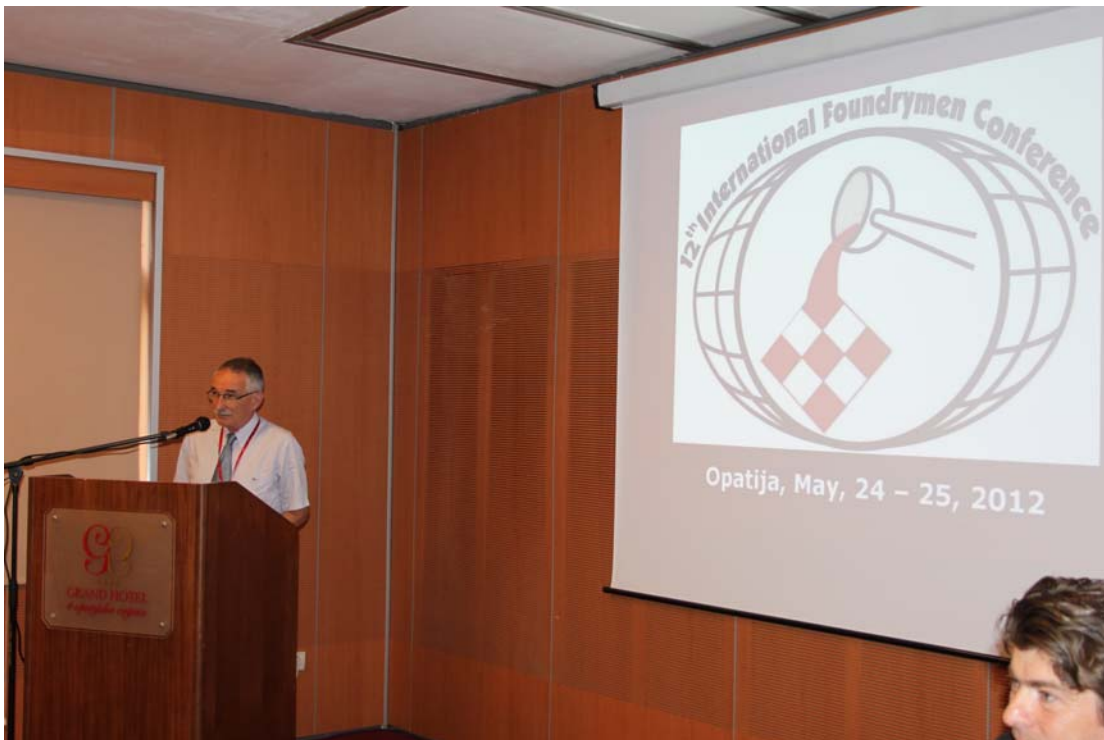
SVEČANO OTVARANJE SAVJETOVANJA