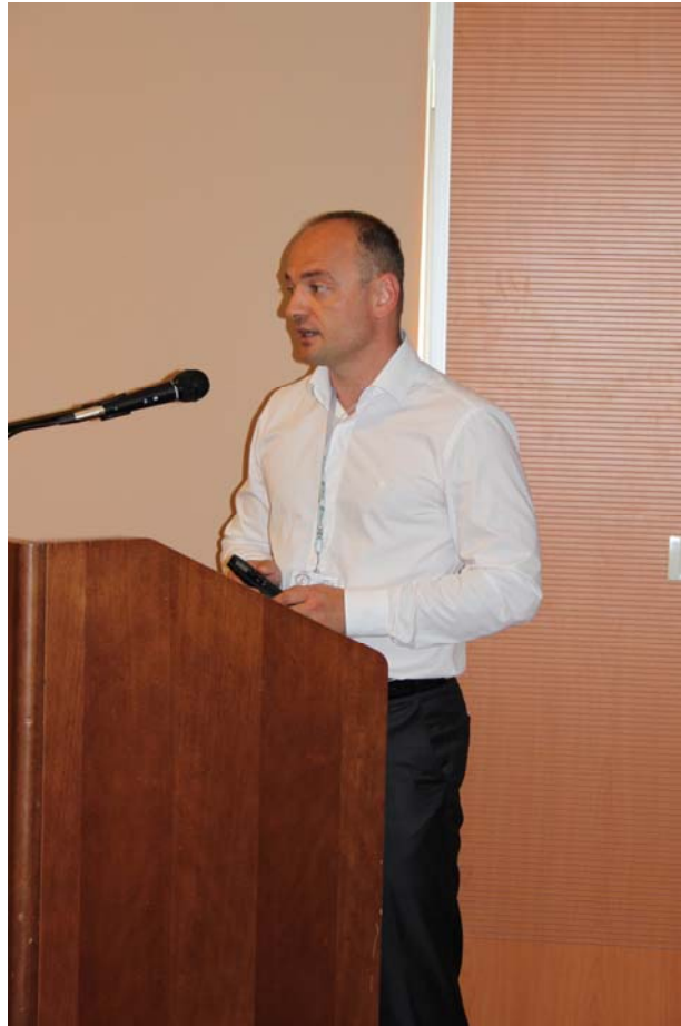
BENTOPRODUCT d.o.o., BANJA LUKA, BiH (G. Saša Grbić)