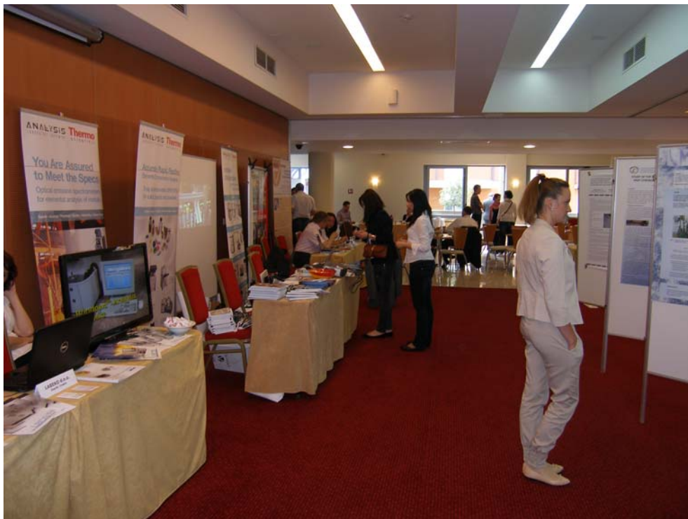
IZLOŽBENI PROSTOR S POSTER SEKCIJOM