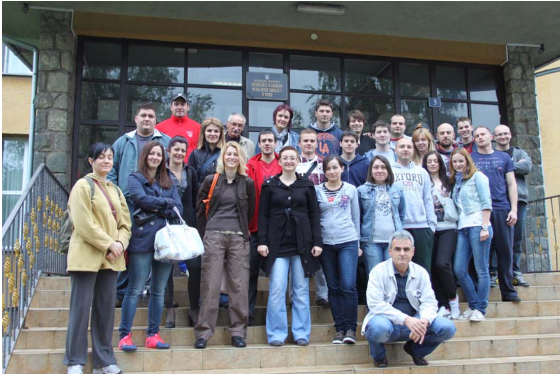
PRIJE POLASKA NA PUT ...