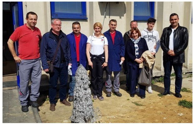
Jajce Alloy Wheels d.o.o., Jajce