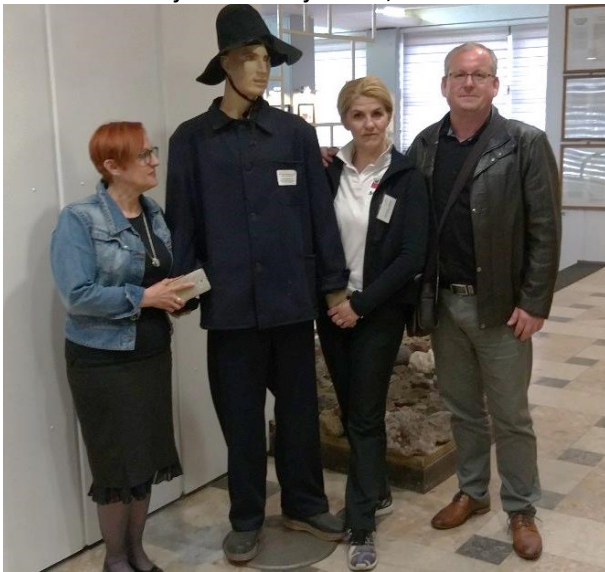
ArcelorMittal Zenica, Zenica