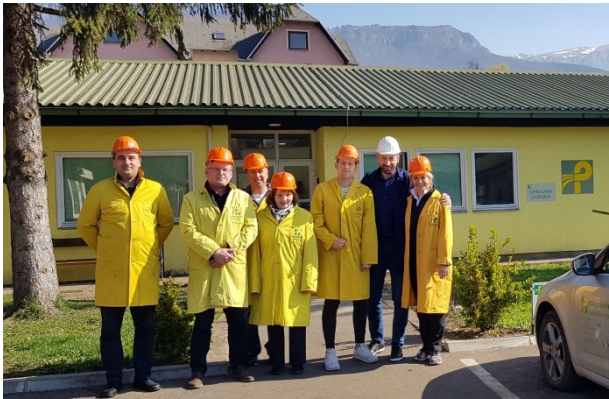
Pobjeda-Tešanj d.o.o., Turbe