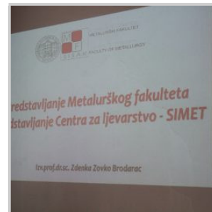
( https://unze.ba/predavanja-prof-sc-zdenke-zovko-brodarac-na-metalursko-tehnoloskom-fakulte/img_5767/ )