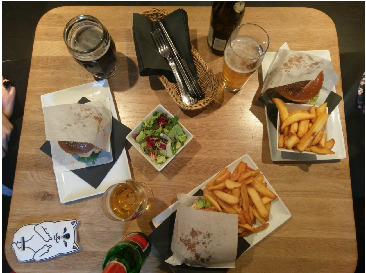
Prosječan studentski obrok