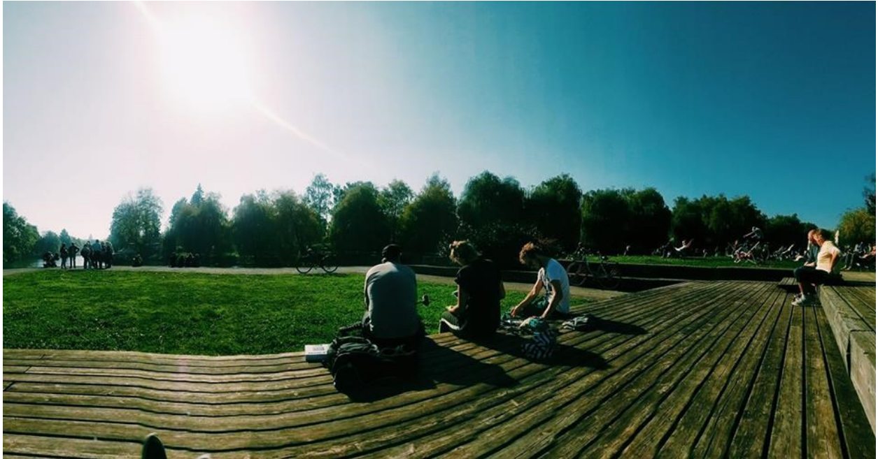
Sunčanje na Prulama