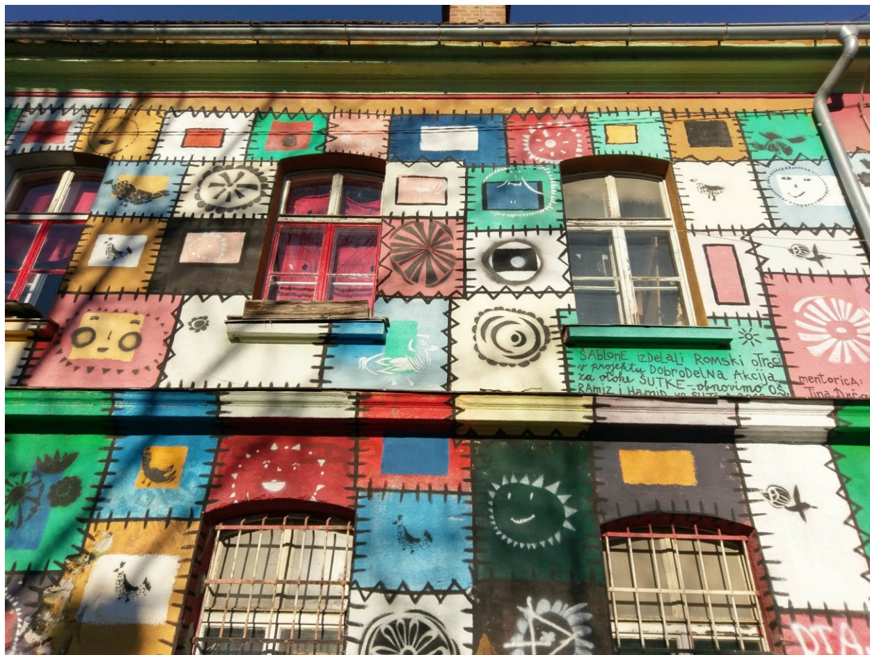
Street kultura / Metelkova mesto