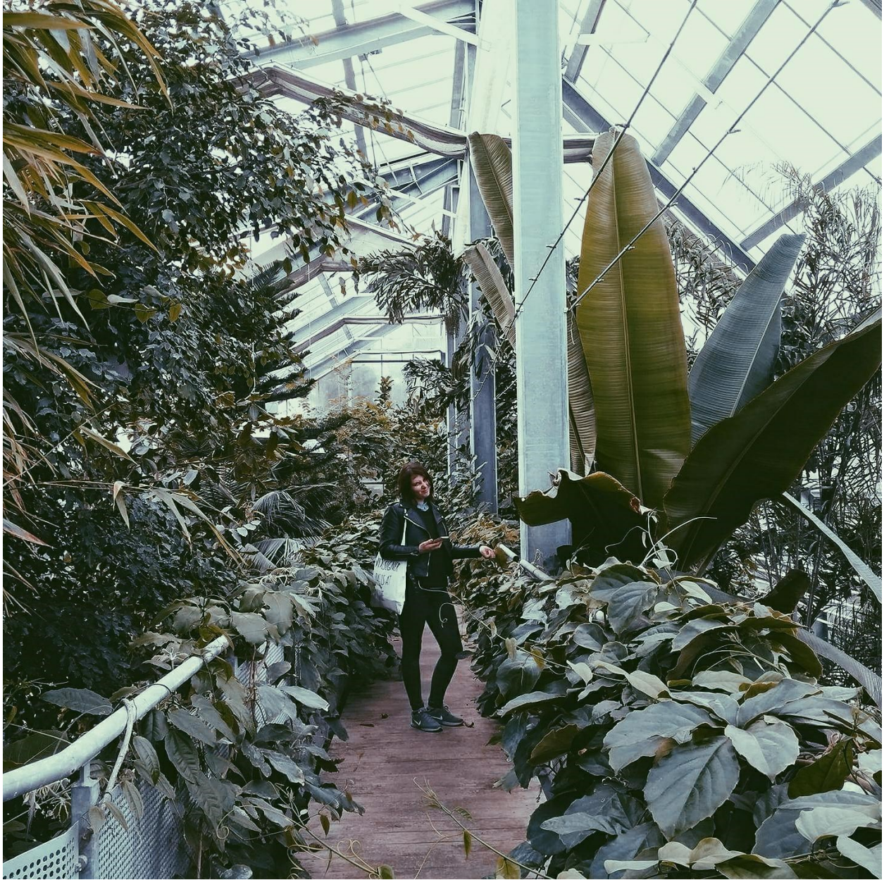
Moi u botaničkom vrtu