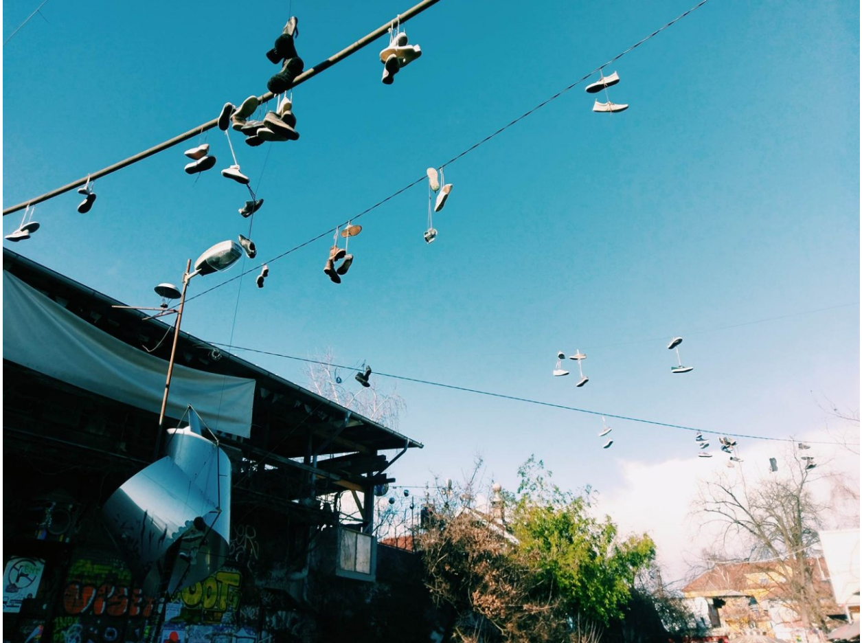
Metelkova mesto i instalacije s tenisicama