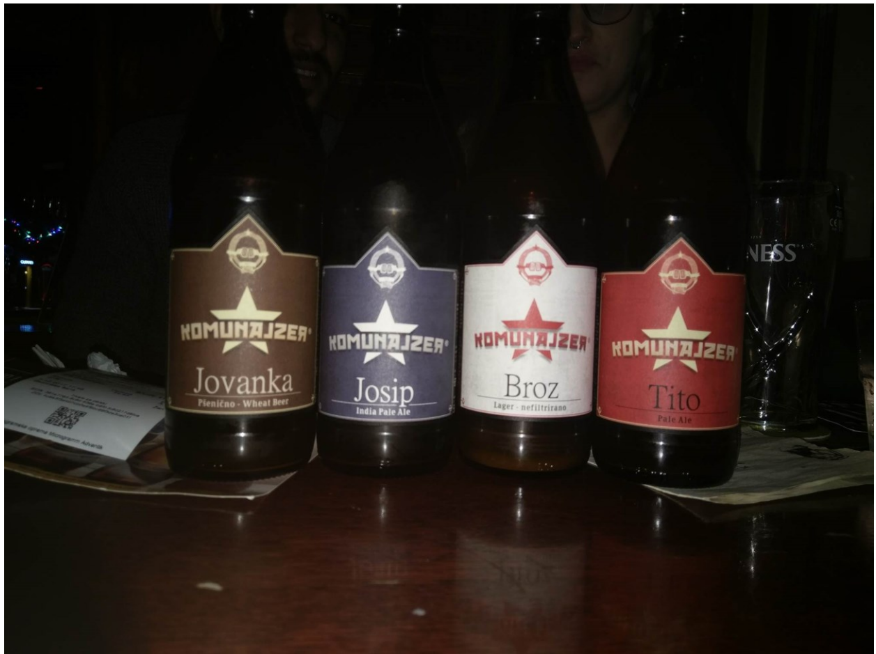
Vječni strah Slovenaca od Jugoslavije