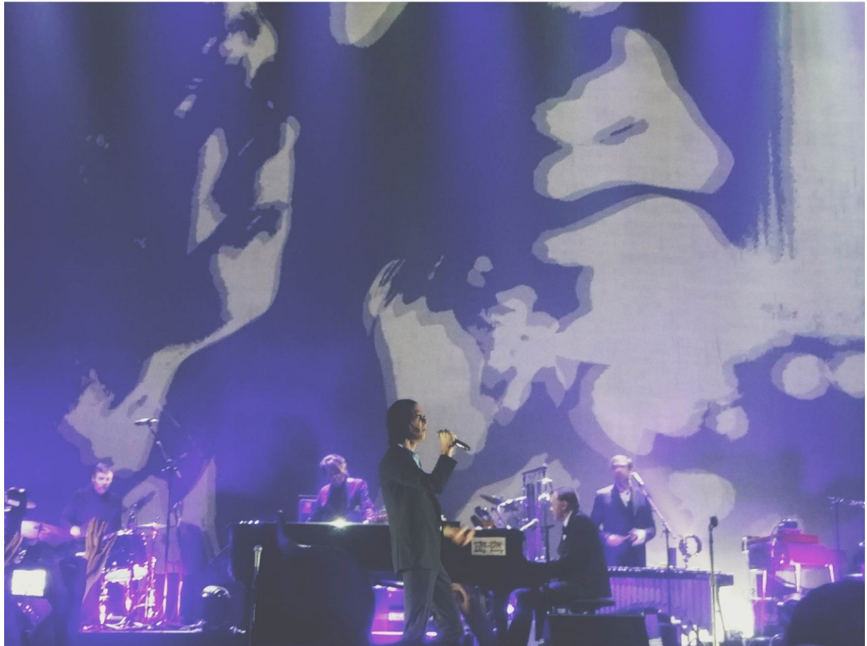
Koncert Nick Cave and the Bad Seeds-a u Areni Stožice