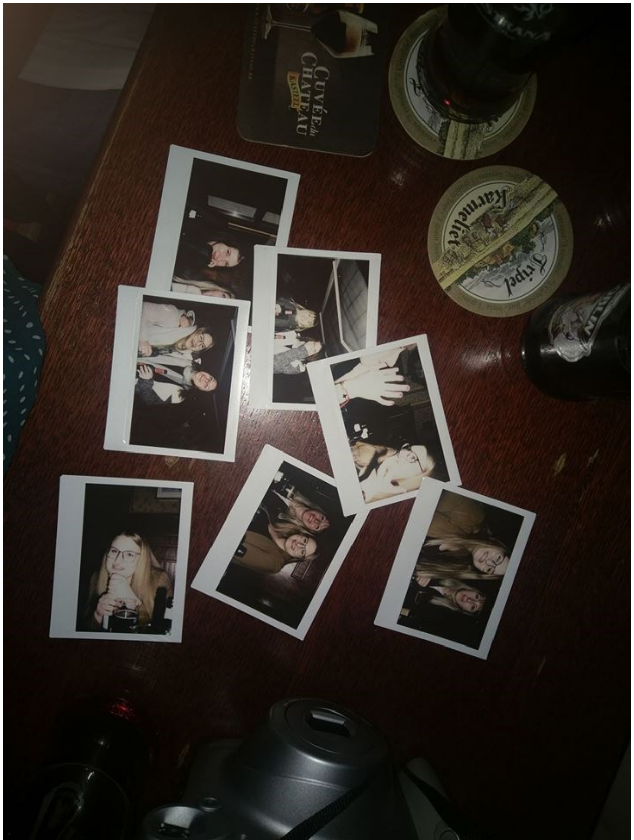
Polaroid fotografije izlaska s prijateljicama