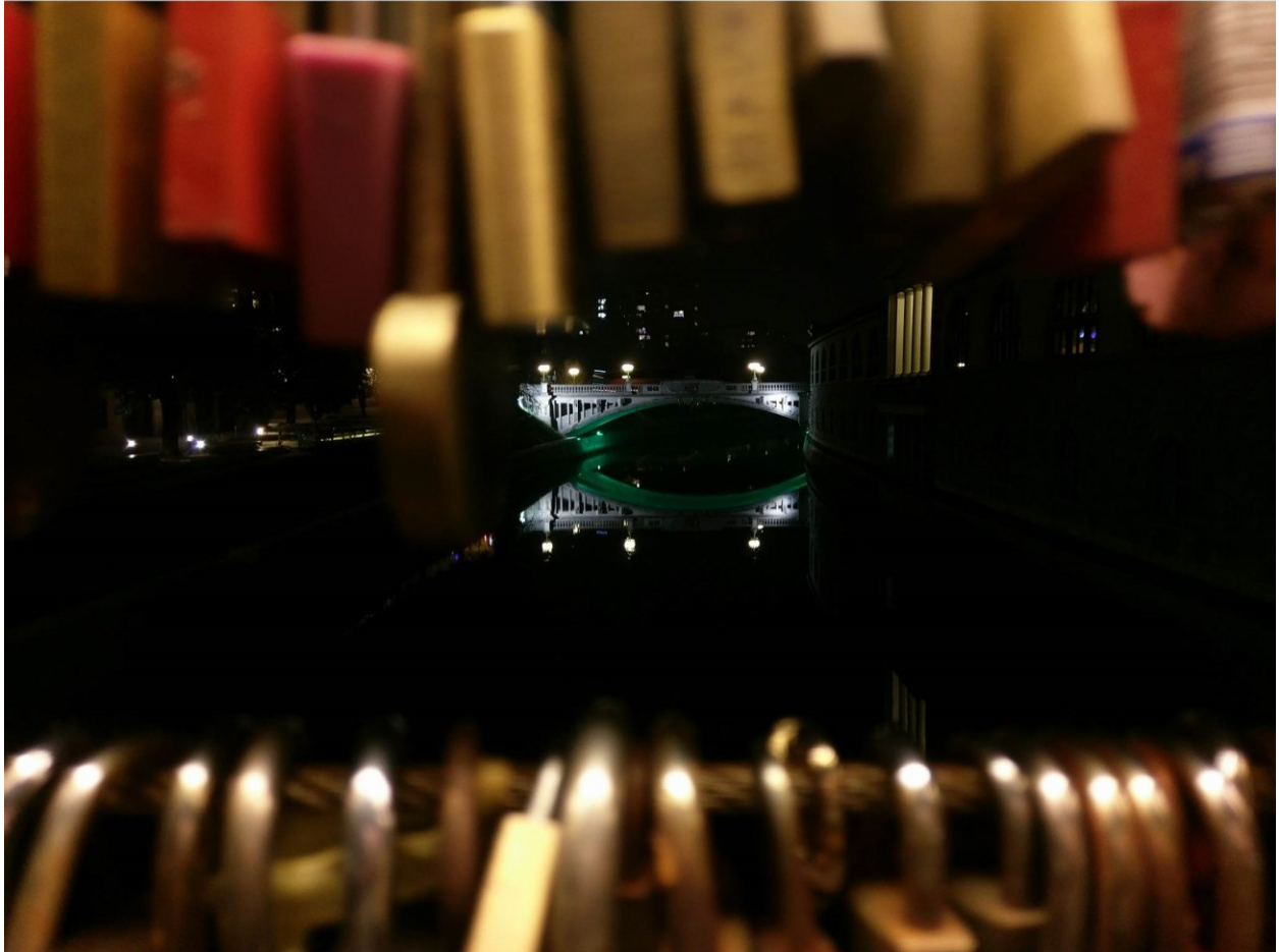
Pogled na Zmajski most s Mesarskog mosta