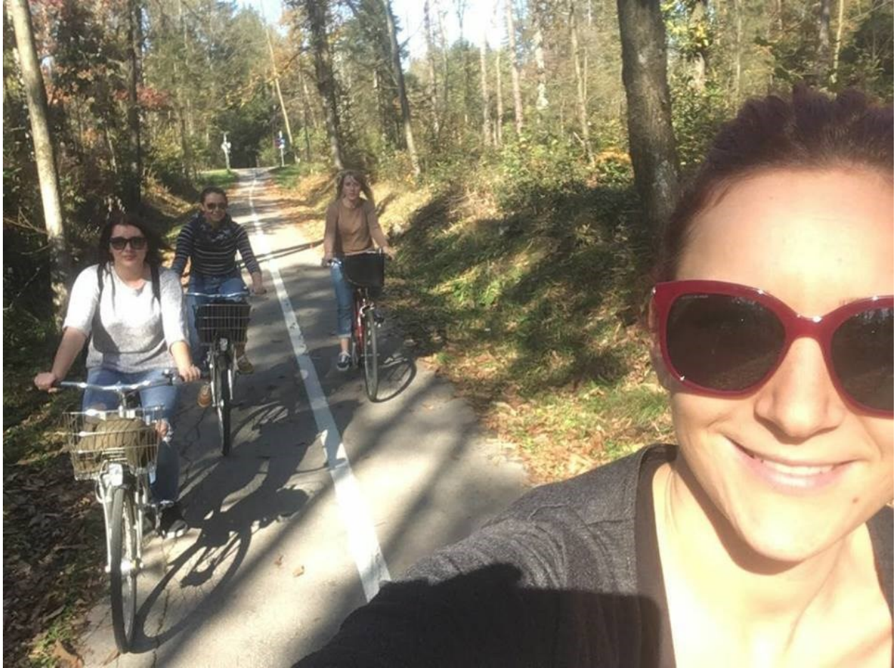
Vožnja kroz park Tivoli