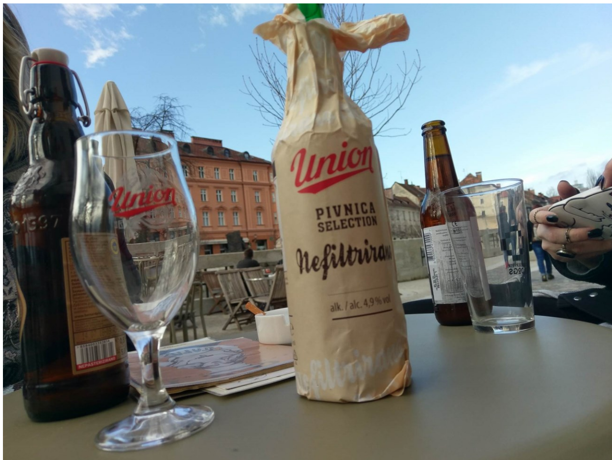
Najbolje pivo pokraj Ljubljane