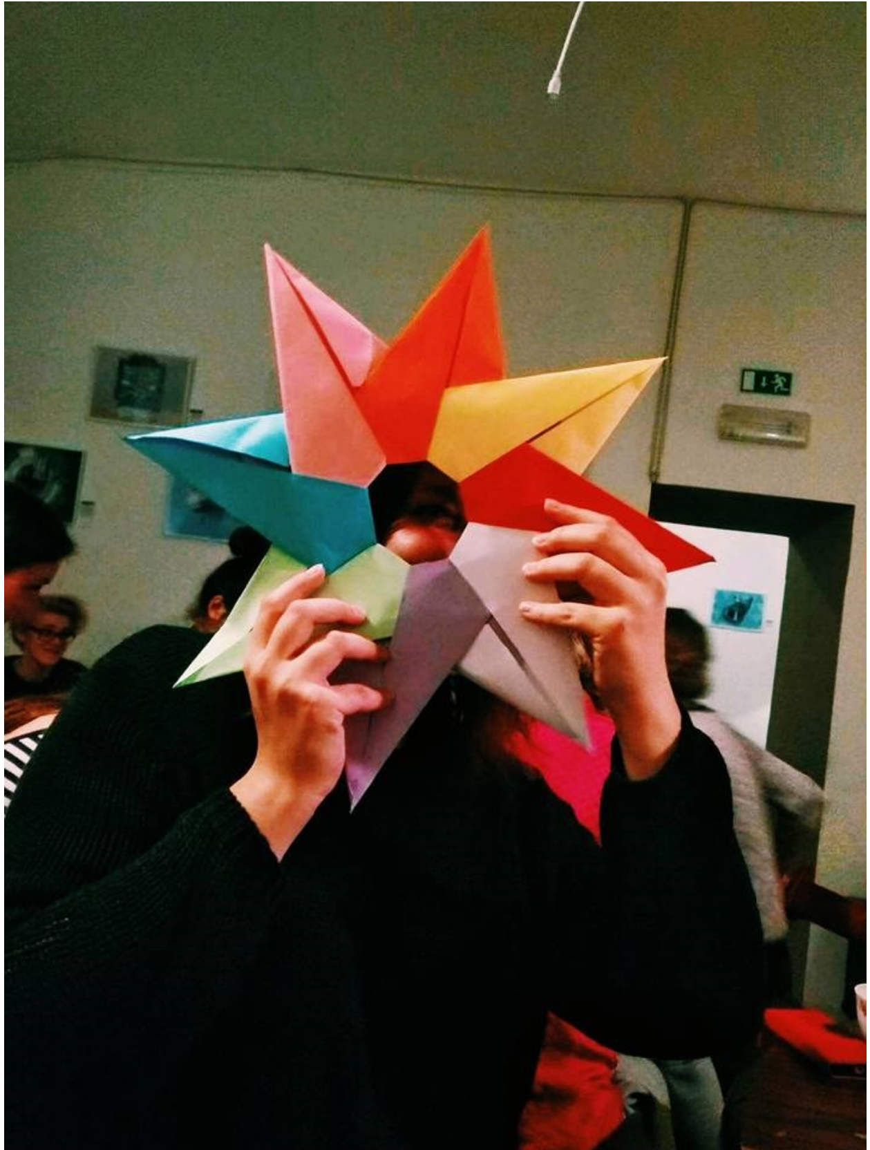
Moj origami uradak