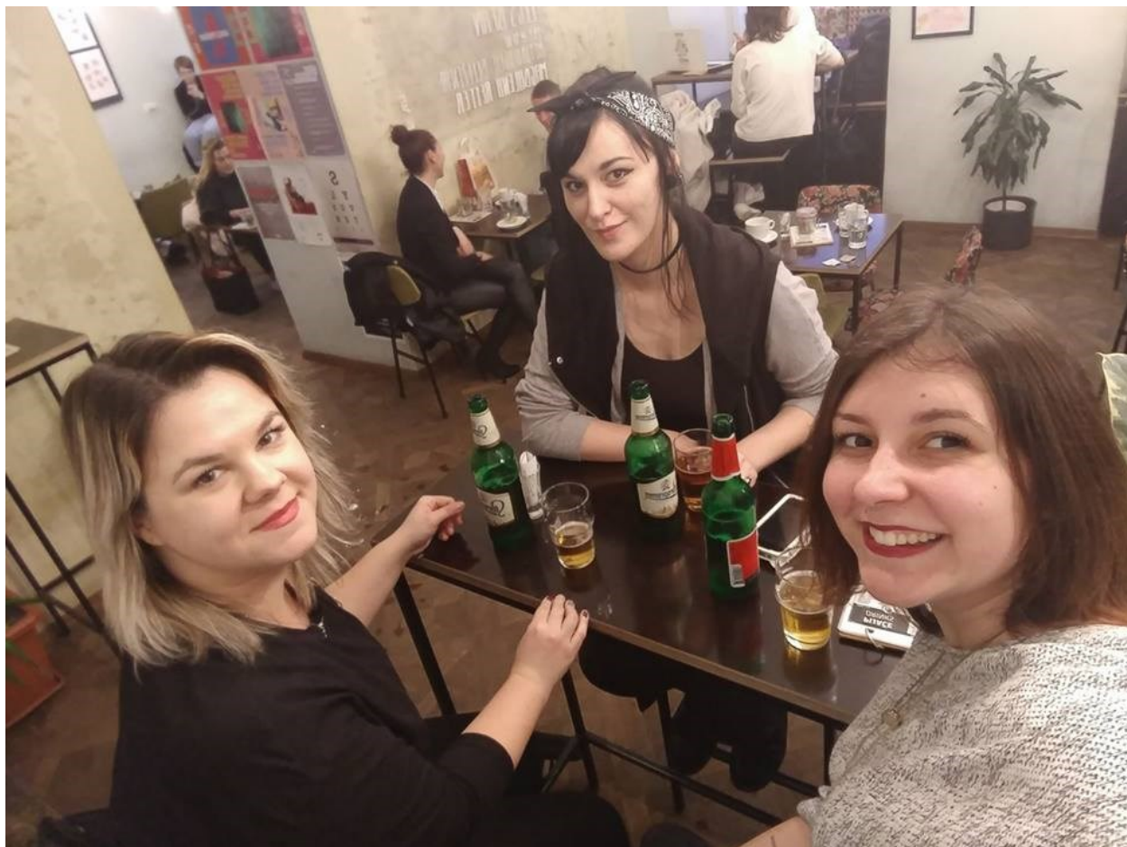
Najbolja kava u Ljubljani u Pritličju (piva je generična, Union je bolje od Laškog)