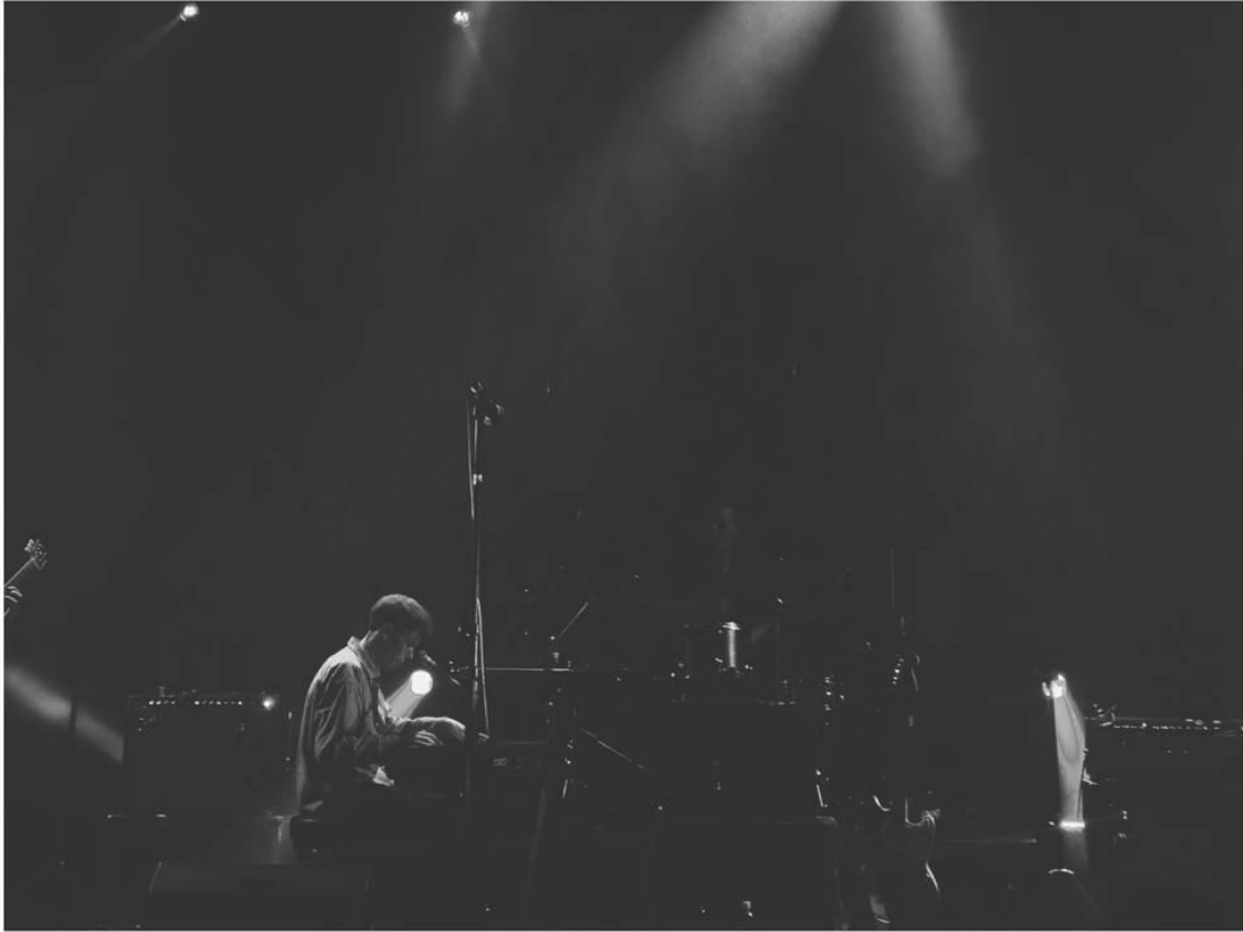
Koncert King Krulea u Kino Šiška